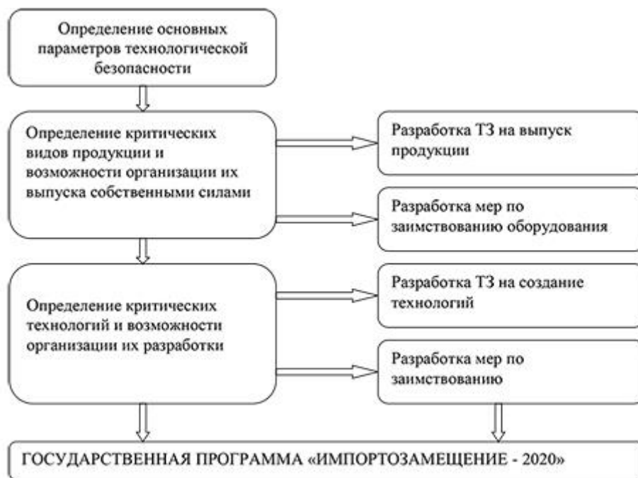
Рисунок 2 – Схема формирования программы «Импортозамещение-2020»

Устойчивое экономическое развитие автономного округа связано с реализацией основных программ и мероприятий, направленных на повышение благосостояния общества, улучшение инновационной и инвестиционной составляющей, образования и т. д.